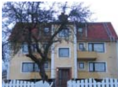
Falken 9 (1954)