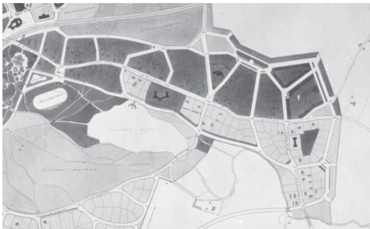
1912 års stadsplan (beskuren).