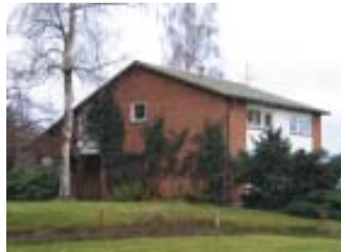
Tjädern 2 (1961)