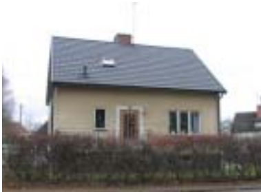
Rapphönan 21 (1947)