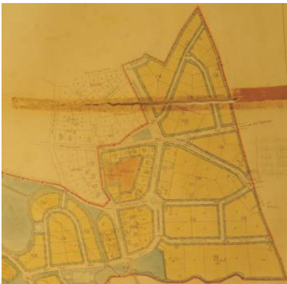
1912 års stadsplan (beskuren) visar de åtta nya kvarter som planlades åren kring 1930.

I ytterkant av det planlagda området inritades ett system av gator, bl.a. Östra Esplanaden som gick norrut från en kilformad plats vid Storgatans östligaste ände. Vad var tanken med denna imponerande, men korta, gata? Att den skulle förlängas och utgöra en huvudförbindelse med framtida stadsdelar norröver? Östra Esplanaden kom att förverkligas, men är idag inte mer än en gatstump med ett storstilat namn. Frånsett att Östra Esplanaden byggdes enligt 1912 års plan, var det just i detta avsnitt av stadsdelen