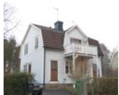
Ripan 10 (1930)