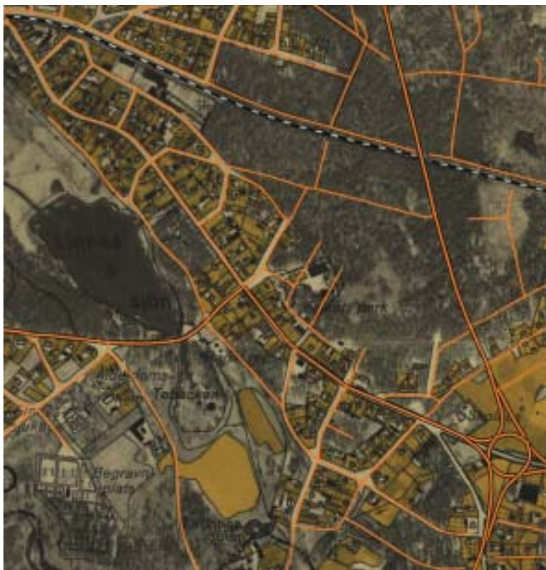
1941 års ekonomiska karta med dagens gatunät inlagt i orange färg.

som planen inte kom att genomföras. I övrigt anlades stadsdelens samtliga kvarter och gator som de ritats. Under 1910- och 1920-talen uppfördes ungefär ett fyrtiotal hus i de nya kvarteren.