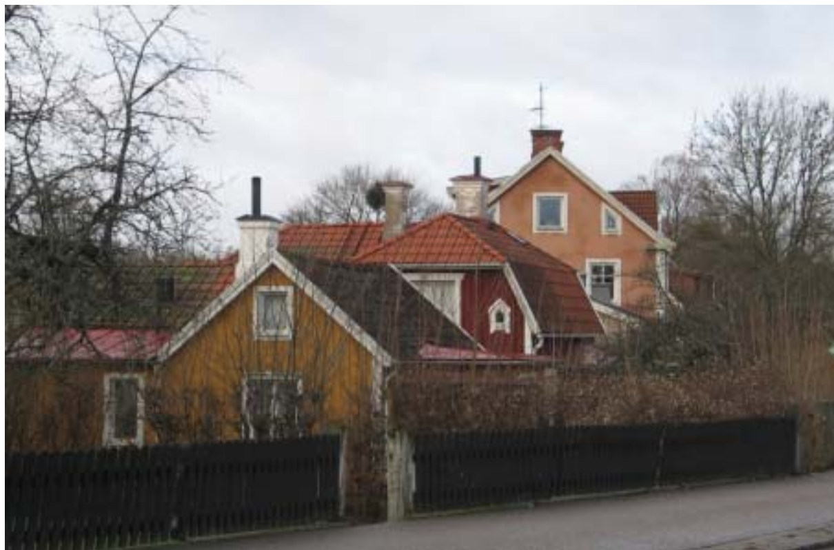
Storgatan, kvarteret Falken.