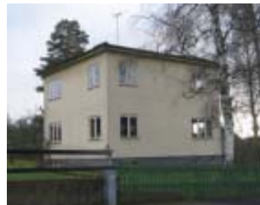
Tjädern 3 (1936)