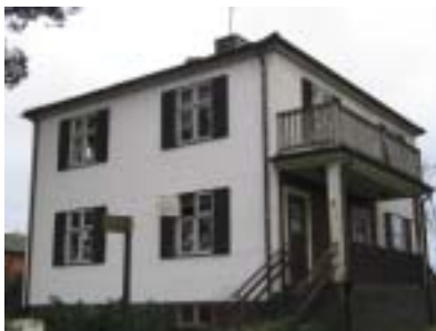
Tjädern 15 (1936)