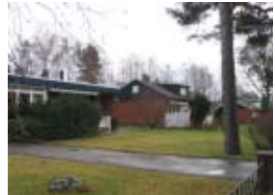
Kråkan 15 (1968)

... och mindre flerfamiljshus från olika tidsperioder.