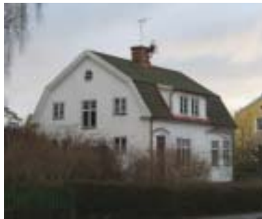
Geten 7 (1929)