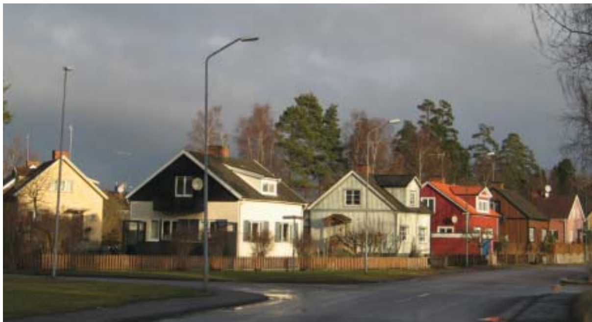
Fågelvägen, kvarteret Rapphönan med s.k. "barnrikehus", byggda omkring år 1940.

tidsmässigt spänner över närmare ett sekel, ligger nästan som inklämda mellan varandra och tomtstrukturen är oregelbunden. Kvarteret är format av Storgatans kraftiga sväng. Det här är inget enhetligt och planerat sammanhang, utan en del av staden som successivt växt fram och i stora delar "blivit som den blivit".