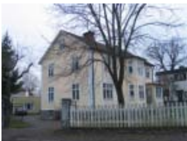
Trädgården 2 (1930)

... och mindre flerfamiljshus från olika tidsperioder.