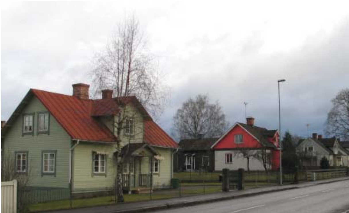
Utmed Storgatan, kvarteret Tjädern.