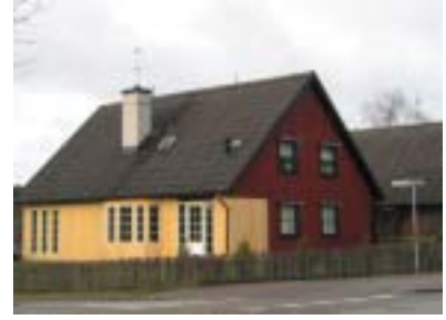
Falken 22 (1974)