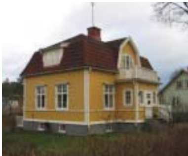
Tjädern 17 (1920)