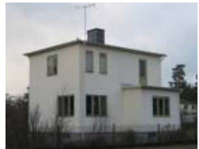
Geten 6 (1944)