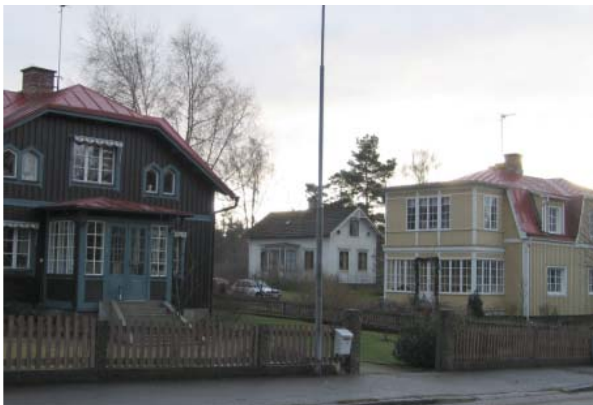
Pukebergsgatan, kvarteret Ejdern.