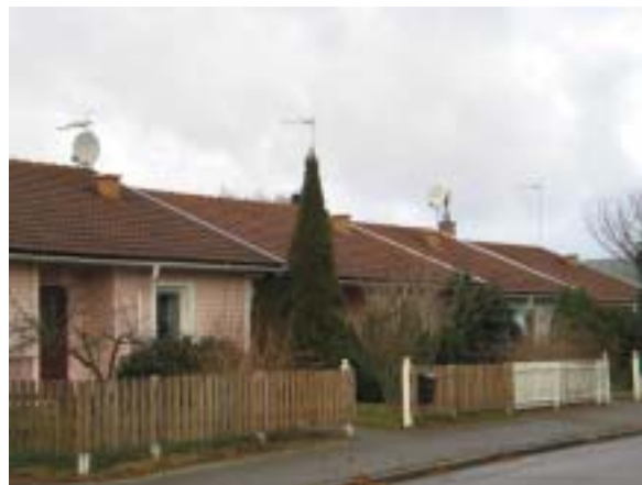
T.v. Teatervägen, kvarteret Hackspetten, med kedjehus från 1976. T.h. Videgatan, kvarteret Rosen, med radhus från 1983.