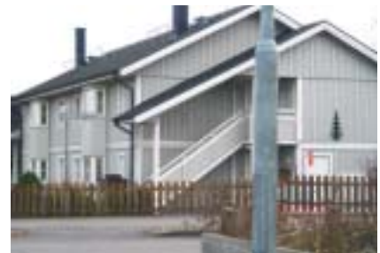
Geten 4 (1936?/1991)