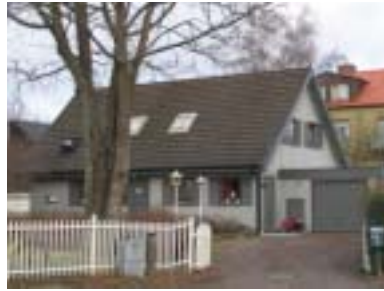
Svanen 13 (1979)