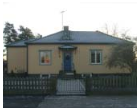
Blodrisikan 1 (1936)