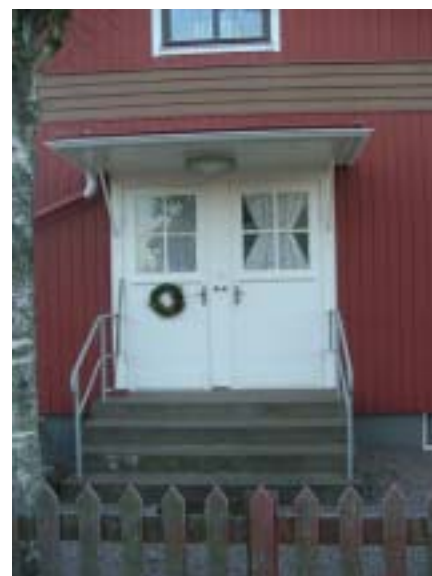
Uthus hör till nästan alla de äldre husen i både Idehult och Bidalite. Flera av de äldre egnahemmen byggdes med två lägenheter. Skivlingen 7.

på enkel bredd och idag tillbyggda. Alla med ett undantag är uppförda i 1 ½ plan under sadeltak. Undantaget är en pytteliten enkelstuga i två mycket låga våningar. Här finns också några rejält stora bostadshus från 1900-talets allra första år med stråk av nationalromantik och sparsmakad snickarglädje. Villorna sydväst om Högalidsvägen, som landsvägen heter här, är styckebyggda under 1980-90-tal i kvarter om sex tomter: Huvudsakligen enplansvillor under flacka sadeltak täckta av mörka takpannor och fasader klädda med stående träpanel målade i olika färger.