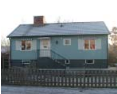
Murklan 9 (1952)