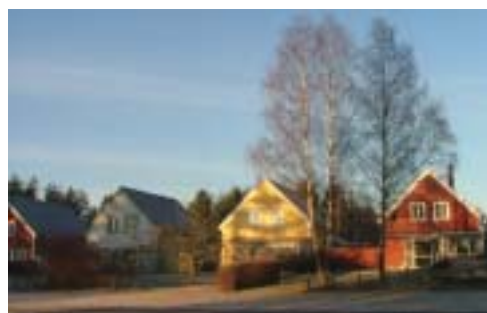
Kvarteret Trillan (1983)