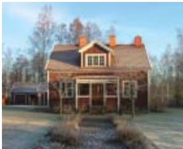
Hovslagaren 6 (1936)

Så kom egnahemmen under 1900-talets första decennier.