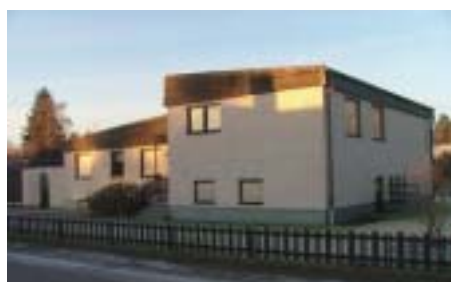
Musseronen 5 (1974)