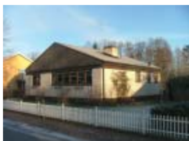
Vårdshuset 8 (1972)