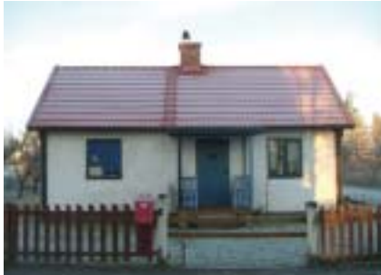
Taggsvampen 4 (ca 1890)

Många äldre hus längs vägarna i Idehult och Bidalite var en gång torp och lägenheter.