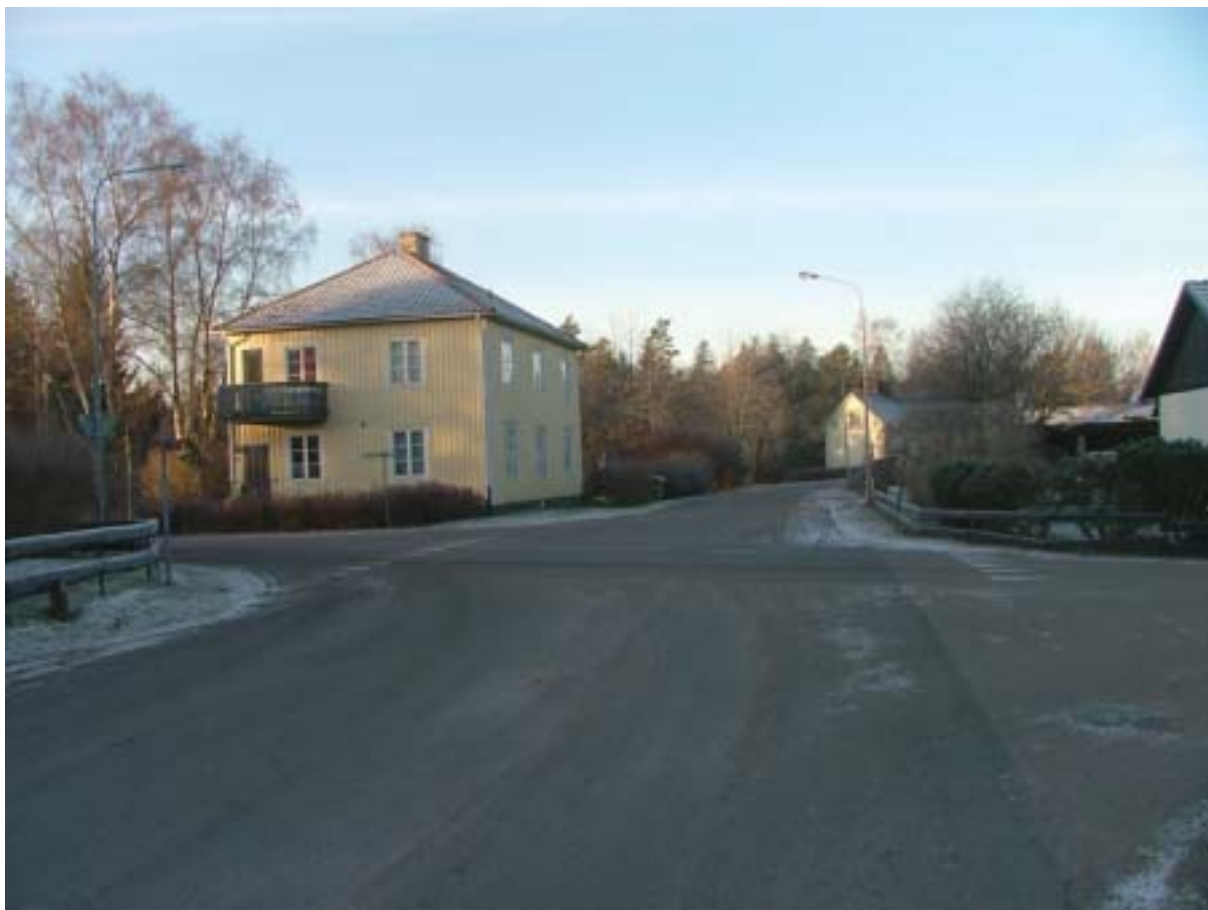
Väggkorsningen i Bidalite är än idag en aktuell vägknut. Det stora gula huset var affär.

De torp och lägenheter som hade etablerats under 1800-talet fick vid 1900-talets början sällskap med egnahem. Vid 1930-talets slut var vägarna runt Bidalite kantade av tomter, sannolikt spontant och helt "oplanerat" avstyckade. De tomma tomterna närmast norr om väggkorsningen bebyggs successivt under 1960-talet med friliggande villor. Den från Nybro inlånade stadsarkitekten Nils Larsson upprättade 1957 en byggnadsplan för de södra delarna av Bidalite. Planen var ett första försök att reglera den "vilda" byggnationen utmed landsvägen och tillskapa nya tomter. 1965 fastställdes en utvidgad byggnadsplan som i princip bekräftade och säkerställde rådande förhållande.