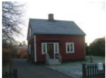
Champinonen 22 (1925)