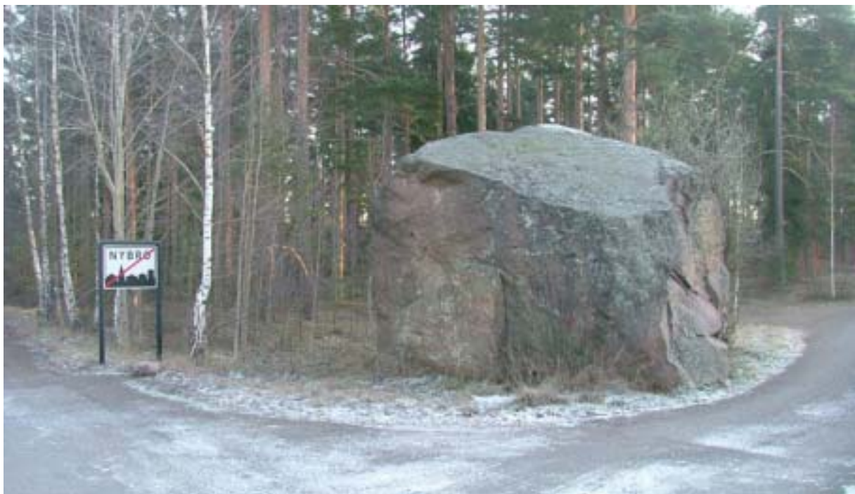
Ett jättestort flyttblock hälsar en välkommen till Nybro när man kommer från Desemåla.

Det nya Gröndal domineras av radhus i såväl ett som två plan med stående träfasader målade i ljusa färger under sadeltak täckta med röda takpannor. Radhusen utgör en HSB-bostadsrättsförening. De låga villor som ligger på rad i områdets östra del ger alla intryck av att vara mycket stora. De har ljusa träfasader under valmade och på olika sätt brutna tak täckta av mörka takpannor. Allt präglat av det sena 1900-talets byggande.