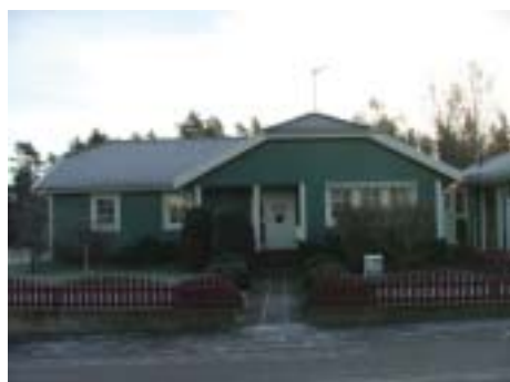
Gryningen 6 (1991)

...och mot 1900-talets slut även radhus och grupphus.