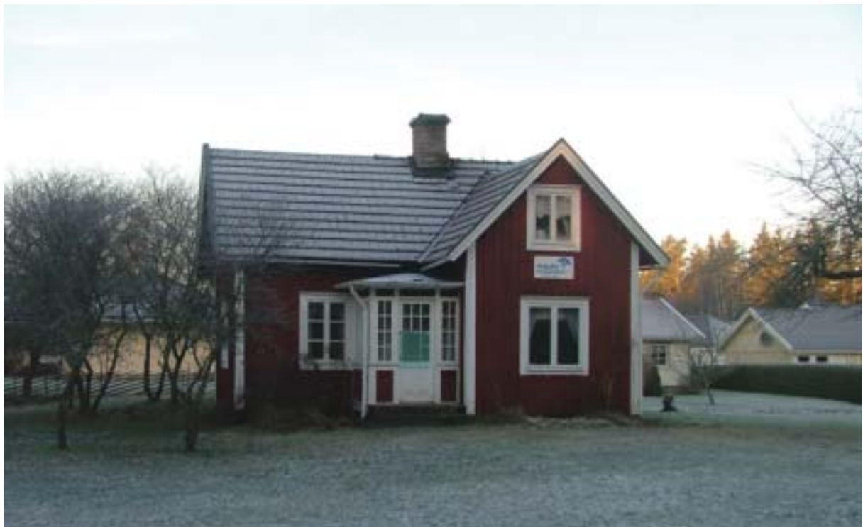
Det fd båtmanstorpets Gröndal är exteriört ett klassiskt torp från sekelskiftet 1900.

Söder om vägkorsningen dominerar äldre hus den nordöstra sidan av vägen, medan sydvästsidan har bebyggts i senare tid. De äldsta husen är torpstugor och lägenheter från 1800-talet, flera hukande låga,