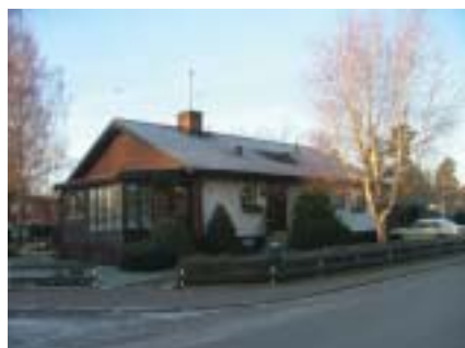
Flugsvampen 5 (1963)