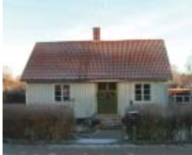
Champinjonen 24 (ca 1890)