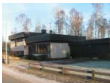
Vårdshuset 1 (1973)