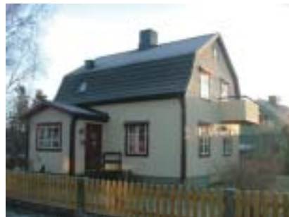
Skivlingen 1 (1938)