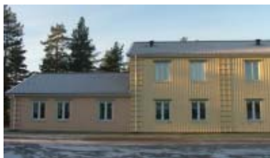
Aurora 1 (1991)

...och mot 1900-talets slut även radhus och grupphus.