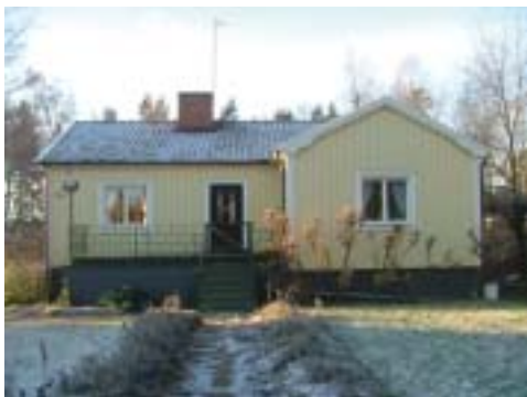
Fingersvampen 9 (1947)