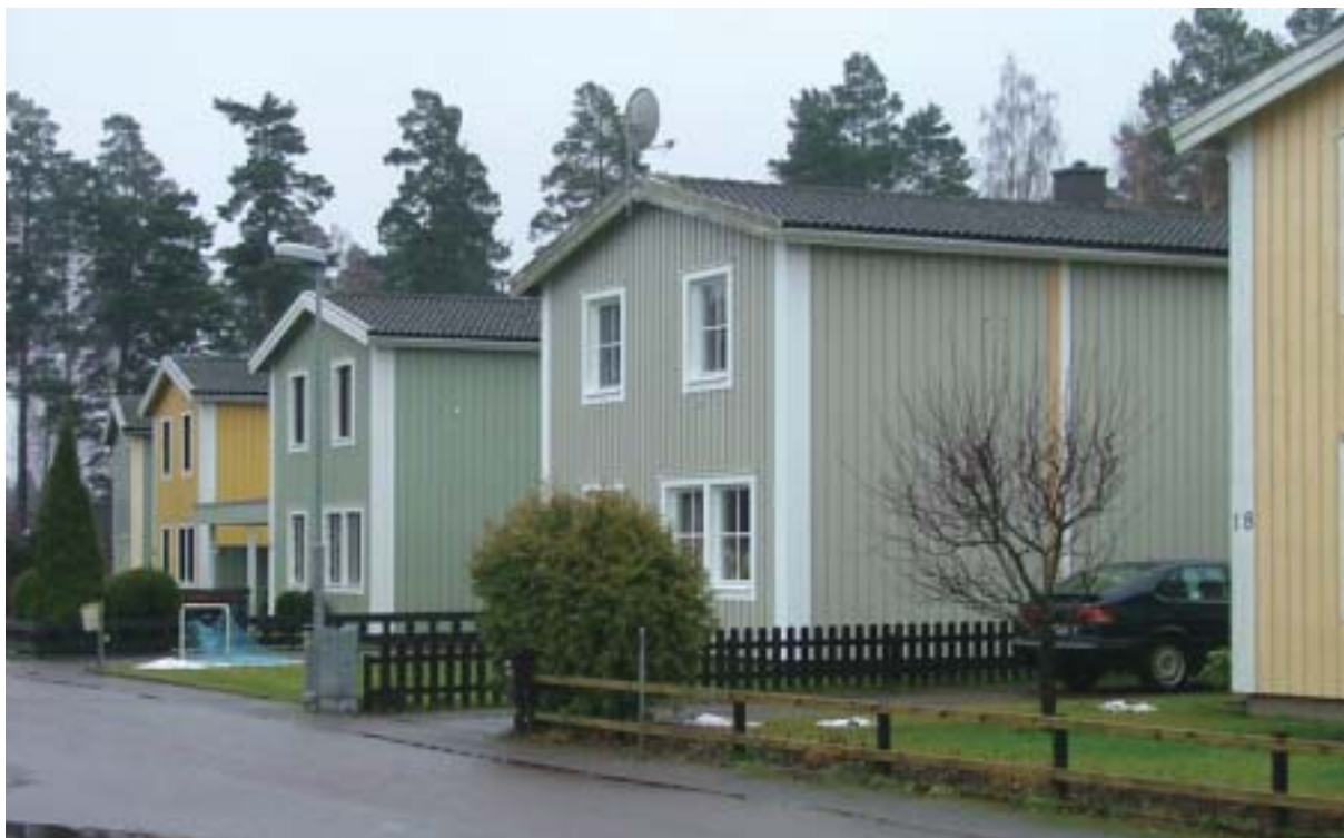
Kedjehus i kvarteret Spöet.

biltrafik och vägbanan delvis uppbruten. Hanes väg är idag den naturliga fortsättningen på gamla landsvägen, inte S:t Sigfridsvägen. Förståelsen för att S:t Sigfridsvägen och landsvägen österut är två delar av samman helhet, har helt gått förlorad.