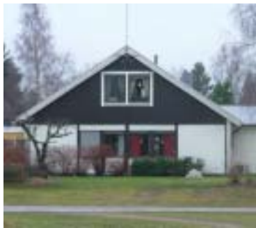
Harven 1 (1979)