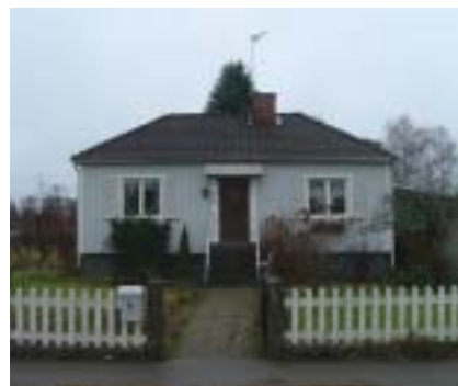
Brunskäran 8 (1939)