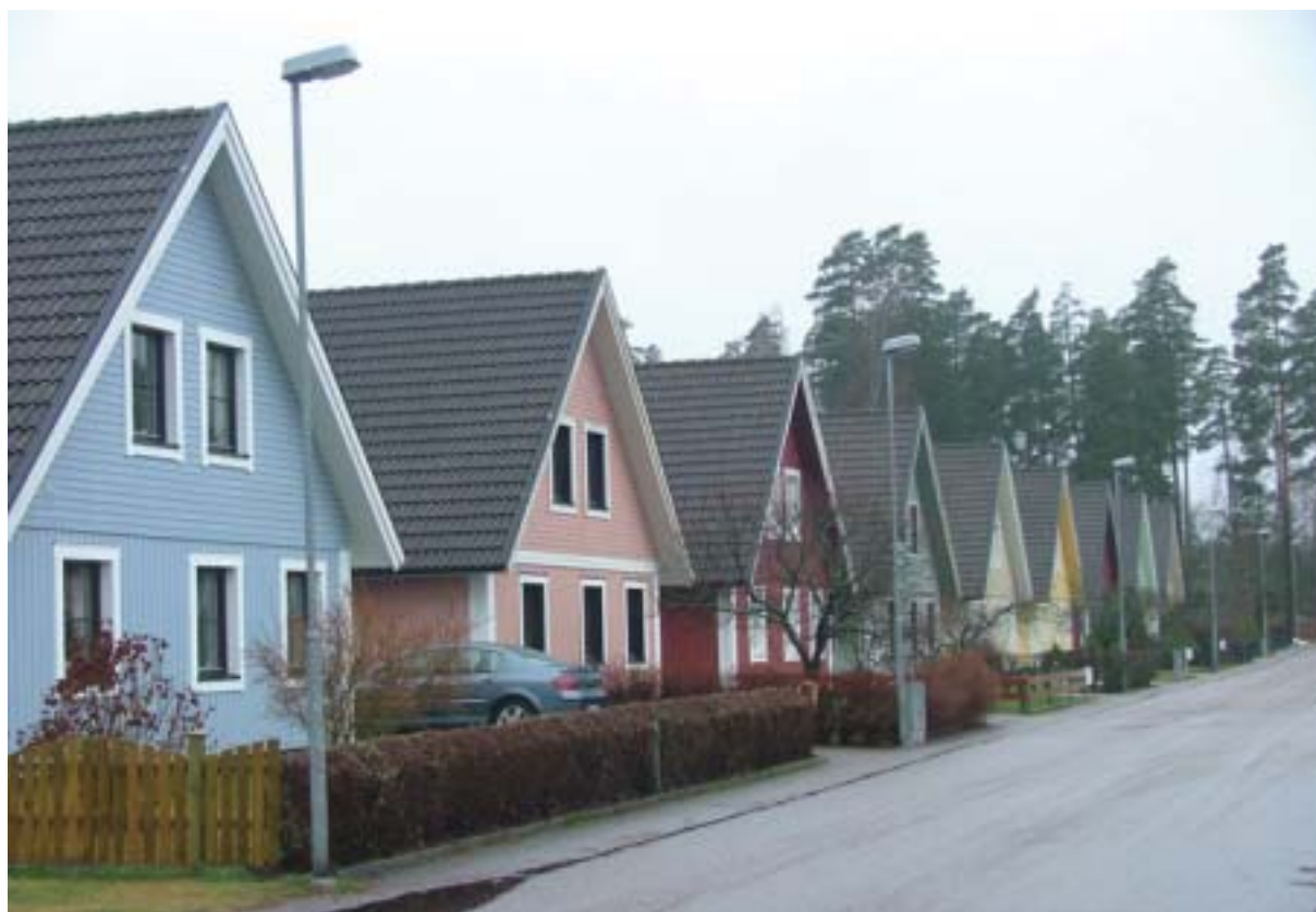
Gäddvägen är kantad av 1 ½-planshus, kvarteret Gäddan.

Gamla landsvägen, nu S:t Sigfridsvägen och östra delen av Hanes väg, slingrar sig ännu mjukt längs bäcken, men är hårt kringskuren åt flera håll: I norr helt utplånad och spärrad av Södra vägen, den nya förbifarten mot väster. I söder mynnar S:t Sigfridsvägen i en nytillkommen Fiskareväg och först efter 90 graders vänstersväng är den åter ute i sin gamla sträckning. På några ställen inom bostadskvarteren är gatan/landsvägen avstängd för genomgående