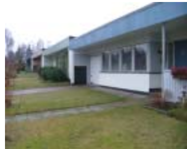
Kvarteret Välten (1970)