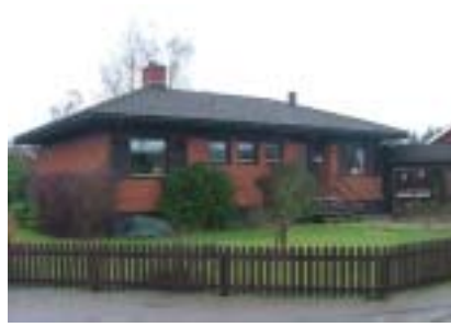
Rädisan 6 (1977)