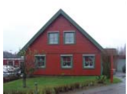
Moroten 2 (1976)