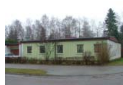
Krattan 16 (1970)