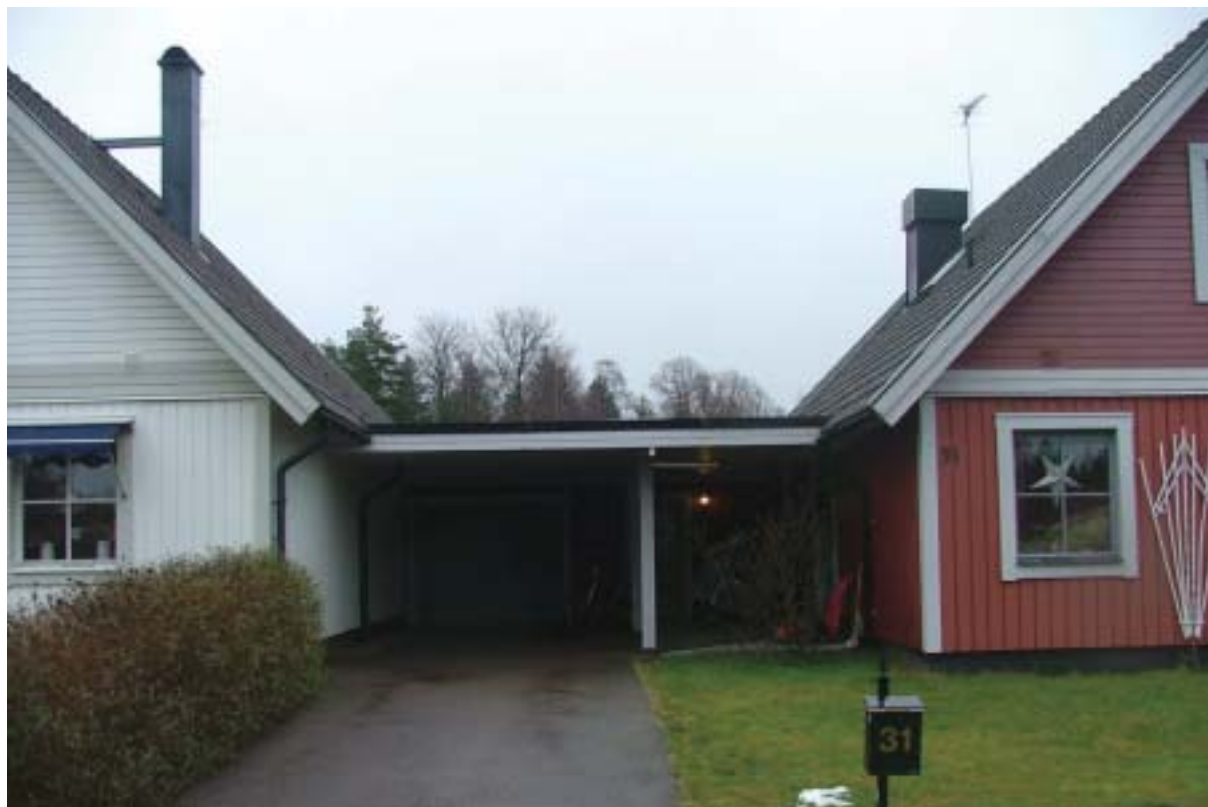
Garagen förbinder kedjehusen med varandra, kvarteret Pepparrotten.

Tegelfasaderna är genomgående oförändrade sedan uppförandet. Garagen, som helt är klädda med träpanel, är mer förändrade. Några kvarter har bebyggt med gruppvis av en typ som i Hanemåla är mycket vanlig och förekommer i lite olika utföranden allt efter byggtid. Husen har lätt rektangulär grundplan, brant sadeltak över 1 ½ bostadsplan, gaveln oftast vänd mot gatan och avskild från grannhusen med garage. Vanligaste fasadmaterialet är träpanel helt eller i kombination med annat material. Gavlarna är till stor del upptagna av fönster eftersom långsidorna nästan är ihopbyggda med grannarnas hus. Utmed bl.a. Vädergatan och Höstgatan är husen lite extra breda och delade mitt i som tvåfamiljshus. Hustypen är nästan omöjlig att bygga till och taken lika omöjliga att lyfta. Takmaterialet är genomgående mörka takpannor. Ju äldre hus desto större förändring av fasadfärg och i viss mån material. Även här är garagen de mest förändrade delarna av husen. De minimala tomterna ger lika minimala trädgårdar med utrymme för föga mer än en uteplats och en liten förträdgård mot gatan. Några storgårdskvarter med kedjehus och gruppbyggda villor från 1960-talet markerar övergången till östra Hanemåla.