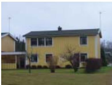
Pepparroten 1 (1976)