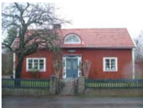
Örtagården 1 (1809)