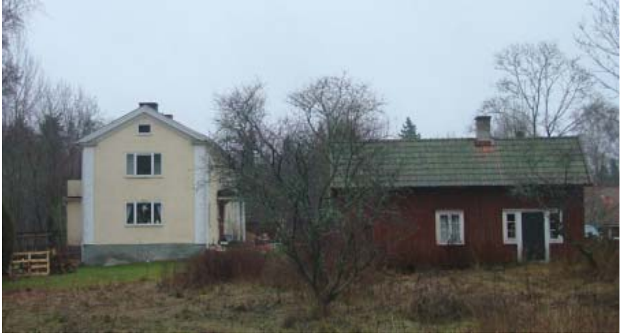
Hanemåla 1:34, den enda bevarade Hanemålagården.

Det moderna Hanemåla är en sentida motsvarighet till Myrdalen. Det sista förverkligandet av den svenska folkhemstanken i Nybro, symboliserad av den egna ägandes villan omgiven av en gräsmattkrans som skiljer det från grannens likadana villa; egnahemmet ersatt av villan, självbyggt mot byggmästarbyggt.