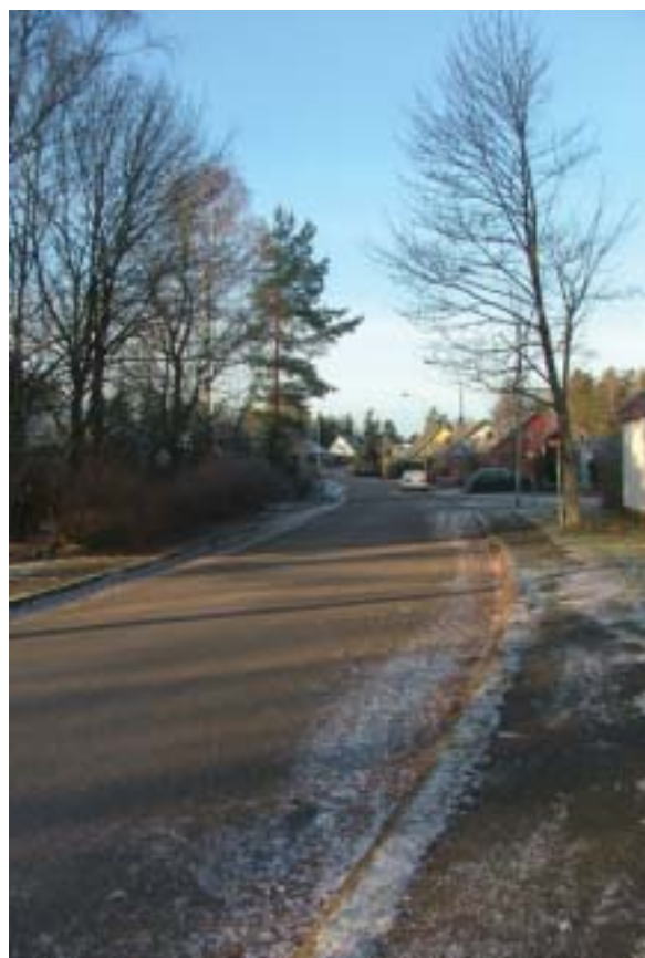
Gamla landsvägen eller Kalmarvägen öster om Hanemåla och som S:t Sigfridsvägen.