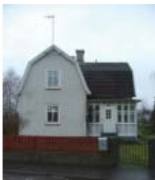
Örtagården 2 (trol. 1920-tal)