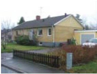
Adonisen 2 (1968)