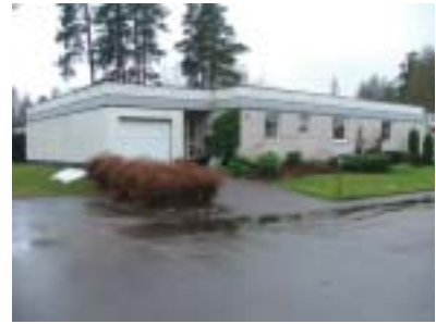
Bräckan 8 (1966)