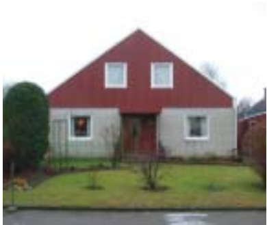
Spettet 15 (1970)